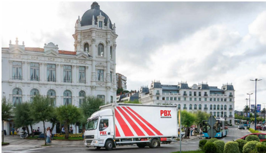
La incorporación a Palibex permitirá a la empresa cántabra ampliar su cobertura y especializarse en paletería exprés.

Con una flota de 65 camiones y un equipo formado por 78 personas, Transportes Victoriano Saiz Echevarría e Hijos dispone de oficinas principales en Villanueva de Villaescusa y un almacén de 2.000 m 2 situado estratégicamente en Argomilla de Cayón.