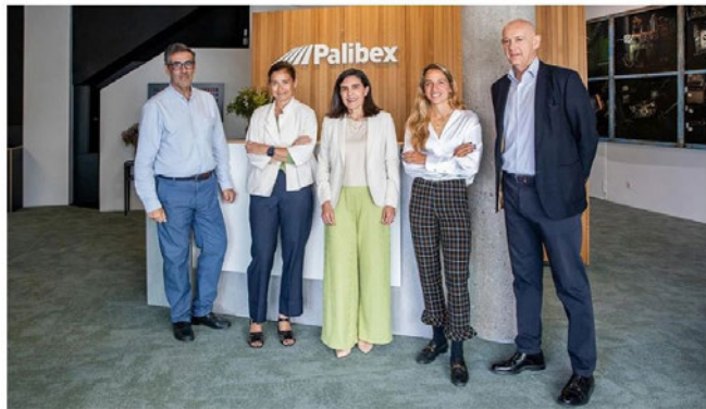
Parte del equipo de Palibex.

"Queríamos dar forma a un compromiso y a una actitud que tenemos desde hace tiempo respecto a la sostenibilidad y esto nos permitirá medir nuestras acciones y poner fecha a nuestros objetivos", añade.