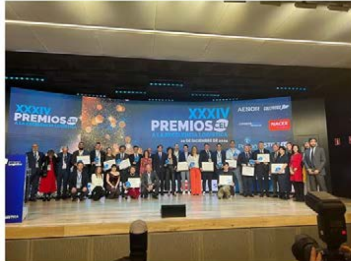
El Centro Español de Logística cerró el año con la entrega de sus Premios CEL en Madrid

Desde su nombramiento hace apenas un año y dos meses, se han desbloqueado algunos de los proyectos más importantes del puerto de Valencia en su última década, como la terminal de contenedores de la ampliación Norte o la Zona de Actividades Logísticas (ZAL) .