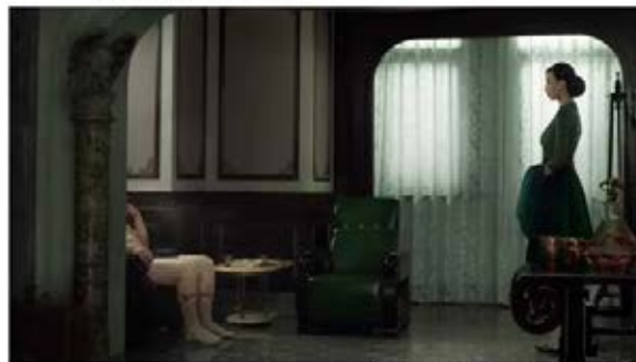
Erwin Olaf, 'Su Mansion, The Parting', de la serie 'Shanghai', 2017

La fotografía de nuestro país estará representada por grandes figuras como Gonzalo Juanes (Sala Canal de Isabel II), Javier Campano (sala El Águila) o dos fotógrafas fundamentales, pioneras de la perspectiva de género en nuestro país: Pilar Aymerich y Paloma Navares (Real Jardín Botánico-CSIC). PHotoEspaña ofrecerá grandes retrospectivas de tres autores internacionales: Erwin Olaf (Fernán Gómez, Centro Cultural de la Villa), en la primera gran muestra dedicada a su obra tras su fallecimiento; el ucraniano Boris Savelev (Espacio Cultural Serrería Belga), cuyo trabajo podrá verse por primera vez en España, y la fotógrafa Barbara Brändli (CentroCentro) con una amplia exposición de su archivo, mayormente inédito. Otros grandes nombres de la fotografía internacional estarán presentes: el japonés Masahisa Fukase, los estadounidenses Elliott Erwit y Consuelo Kanaga, el sudafricano David Goldblatt y el holandés Iwan Baan, entre otros.