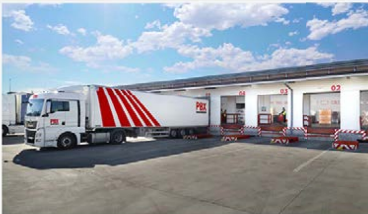
El centro de coordinación de Palibex en Valladolid es operado por Tanden, franquiciado de la red en la zona.

La red de palettería urgente Palibex ha consolidado la operativa de su centro de coordinación de Valladolid. En apenas año y medio desde que iniciaron la actividad, las instalaciones han logrado triplicar el volumen de mercancía coordinada y han generado nuevas rutas "más eficientes y competitivas", dando lugar a que algunas ya existentes hayan doblado el número de vehículos, según señala la compañía.