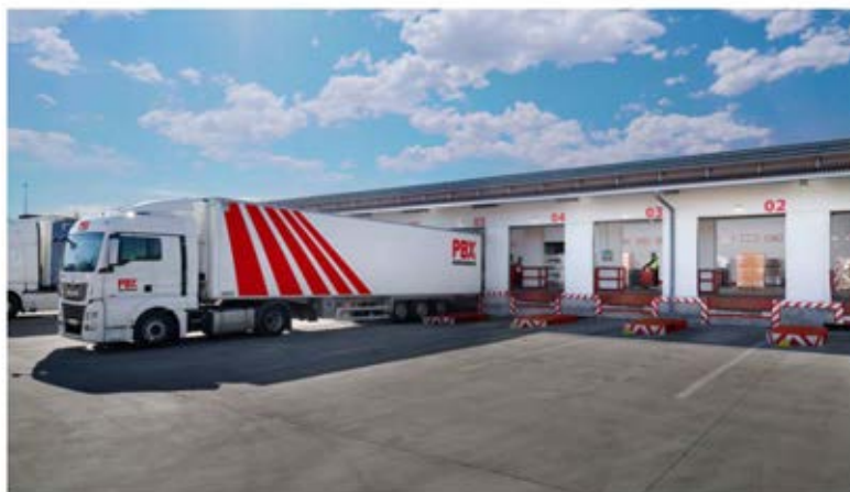
En la actualidad el 82% de los palets transportados por Palibex pasan por la sede central de la empresa, ubicada en Madrid. Hace años ese porcentaje era del 78%.