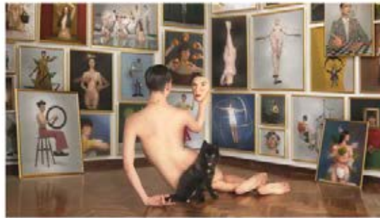
Una de las fotografías de Filip Custic, tomada en 2019. Filip Custic, Cócteles de Onúkis

— Una fotografía que muestra el dolor de las víctimas palestinas gana el World Press Photo de 2024