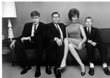
'Shoreport, Luchino, 2017' (1962)

Habrán otros grandes nombres de la fotografía internacional como el japonés Masahisa Fukase, los estadounidenses Elliott Erwitt y Consuelo Kanaga, el sudafricano David Goldblatt y el holandés Iwan Baan.