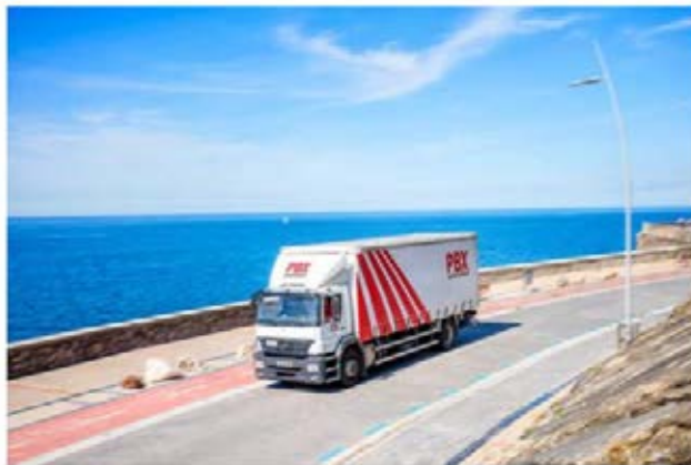
Galiport Vigo confía en Palibex

Por Saúl Camero | 01 Agosto 2024 | tamaño de la fuente | Imprimir | Email