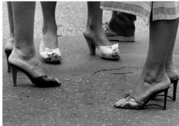
Elliott Erwitt. 'Saint Tropez, Francia', 1979.

Un día con Cristina García Rodero , memoria de la España olvidada