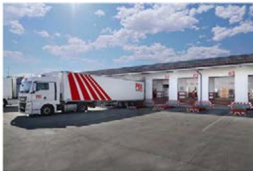
Centro Palibex de Valladolid.

En un año y medio, el centro Palibex de Valladolid, operado por Tanden , su franquiciado en esta zona, ha triplicado el volumen diario de mercancía coordinada y ha generado nuevas rutas, motivando incluso que algunas ya existentes hayan doblado el número de vehículos.