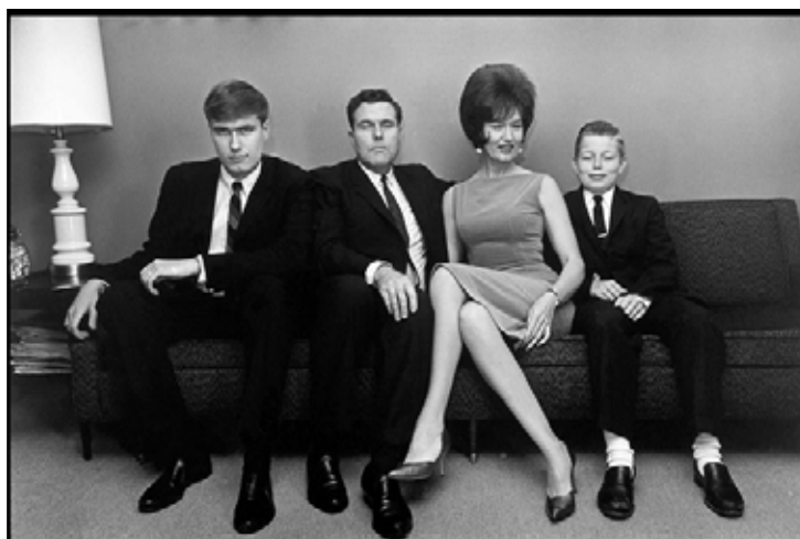
Elliott Erwitt. Shreveport, Louisiana 1962. Magnum Photos

Más colaboraciones: este año, PHotoESPAÑA se une al programa Transcultura de la UNESCO para visibilizar el trabajo de quince fotógrafos residentes en siete países del Caribe; aunar esfuerzos con Fotoseptiembre, una bienal impulsada por el Centro de la Imagen de Ciudad de México, organizando tres de las exposiciones de su programación, y celebrará los cien años del olimpismo femenino español con una muestra centrada en Lili Álvarez y las pioneras del deporte en la Edad de Plata. Será en la Fundación Ortega y Gasset.