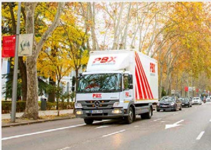
Palibex crece gracias a un nuevo modelo operativo basado en rutas directas y centros de coordinación.

Palibex ha consolidado su nuevo modelo operativo registrando un nuevo incremento de volúmenes el pasado año. Pese a la incertidumbre del sector, tanto Palibex como sus franquiciados están creciendo gracias a un nuevo modelo operativo basado en rutas directas y centros de coordinación .