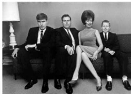
'Thereseport, Louisiana, 1937' (1962)

Habrán otros grandes nombres de la fotografía internacional como el japonés Masahisa Fukase, los estadounidenses Elliott Erwitt y Consuelo Kanaga, el sudafricano David Goldblatt y el holandés Iwan Baan.