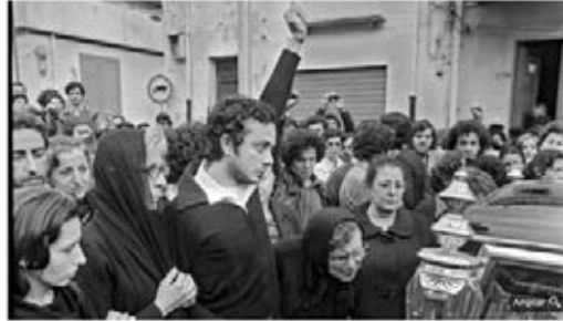
Funeral de Giuseppe Impastato, militante comunista ucciso dalla mafia.