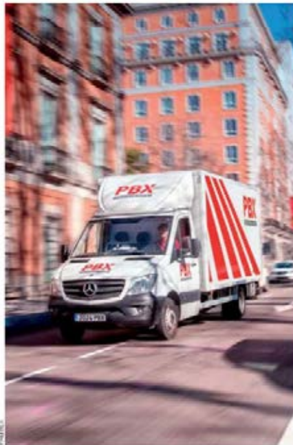
Palibex movió 900.796 palés en 2023, con un crecimiento del 43%.

La compañía, que batió su récord en abril con 87.200 palés gestionados, suma crecimientos del 25% en dos años y apuesta por los megacamiones y duotrailers en sus rutas de larga distancia