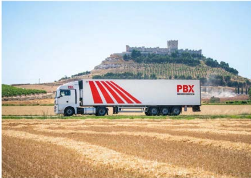
Una de las nuevas conexiones en las que Palibex está trabajando es un enlace con Andalucía, actualmente en fase de pruebas.

El hub está generando rutas más eficientes y competitivas