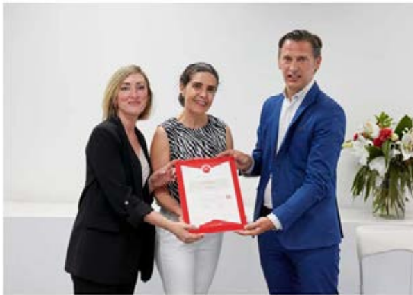
Sello SPAC de Classify para Palibex

Esta primavera las franquicias de Palibex tendrán que superar la auditoría de Classify , que ha endurecido los requisitos exigidos para cumplir la calidad del servicio ofrecido.