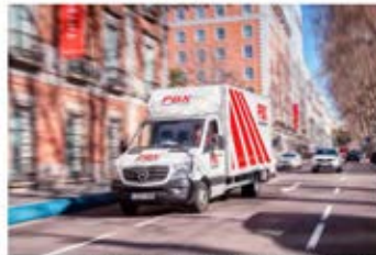
Palibex cuenta con ratio de calidad en las entregas del 98%.

"Queremos contribuir al desarrollo del transporte por carretera en nuestro país y ayudar a todas esas empresas locales que compiten por salir adelante frente a las multinacionales. En definitiva, ser un referente de la marca España para que el transporte "Made in Spain", como dicen nuestros anuncios, sea sinónimo de calidad", apunta.