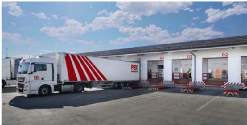
Palibex desplegará medidas de sostenibilidad en diversos ámbitos de actividad.

Palibex se ha incorporado a la iniciativa de sostenibilidad en la cadena de suministro Lean & Green .