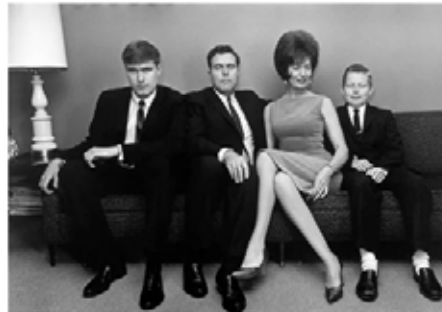
'Shoreport, Luchino, 2017' (1962) Elliott Erwitt, Magnum Photos

Habrán otros grandes nombres de la fotografía internacional como el japonés Masahisa Fukase, los estadounidenses Elliott Erwitt y Consuelo Kanaga, el sudafricano David Goldblatt y el holandés Iwan Baan.