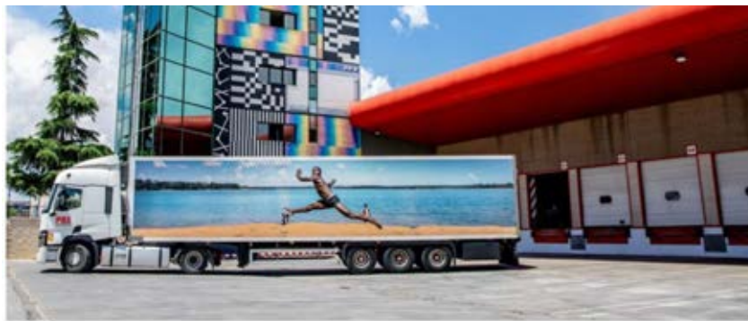
Un semirremolque de 13 metros de largo se ha decorado con las imágenes de la serie 'Art in Movement' de la fotoperiodista Ana Palacios.

Cada vehículo realiza sus rutas comerciales, destinadas a la distribución exprés de mercancía paletizada, en Madrid, Santander, Valladolid y Zaragoza.