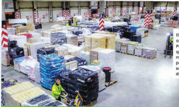
El nuevo modelo operativo de Palibex permite que los palets se mantengan muy poco tiempo sobre el suelo del almacén.