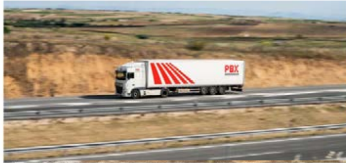
Palibex ha crecido un 25% en las zonas donde se ha aplicado la descentralización del modelo, moviendo cada noche medias que se sitúan por encima de los 4.000 palés.

La Red acaba de estrenar una nueva ruta directa Valladolid-Sevilla