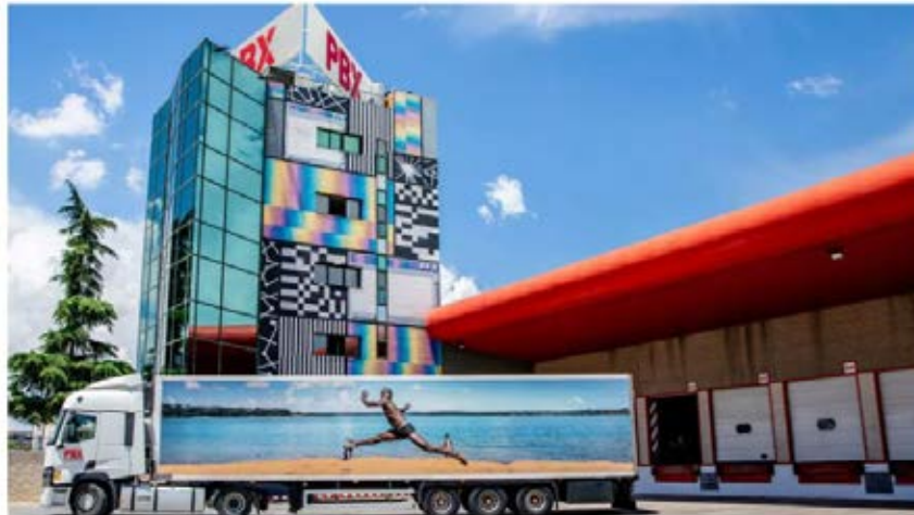
Tráiler con imágenes de la serie "Art in Movement" de Ana Palacios, que podrá verse en Valladolid.