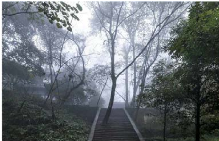
IMAGEN DE JOSÉ MANUEL BALLESTER, QUE ESTARÁ EN LAS NAVES DE GAMAZO DE SANTANDER.

El Centro de Documentación de la Imagen de Santander, CDIS, junto con el Círculo de Bellas Artes de Madrid, traerá a Santander 'Ravens', una de las series más importantes del fotógrafo japonés Masahisa Fukase. Una serie creada en un momento de crisis personal del artista en la que los paisajes costeros de Hokkaido sirven de telón de fondo para sus fotografías profundamente oscuras e impresionistas de ominosas bandadas de cuervos. Masahisa Fukase irrumpió en la escena fotográfica japonesa en los años 60, desafiando las convenciones de la época y explorando temas emocionales y personales en una sociedad en transformación. Fusionó sensibilidad artística con destreza técnica, siendo un innovador en la difusión de su obra a través de revistas y fotolibros, los cuales también estarán presentes en esta exposición. Su extensa serie Ravens. (1975-1986) es, en conjunto, una obra maestra que trasciende fronteras culturales y temporales.