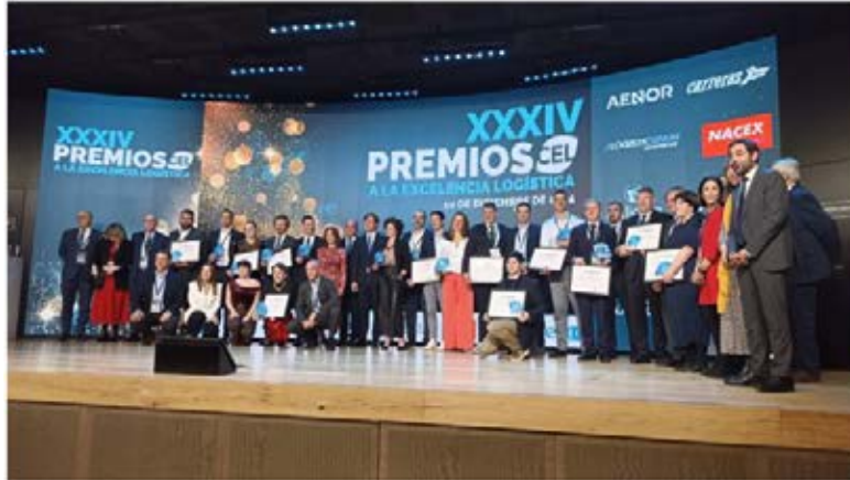
Foto de familia de los galardonados y finalistas de los XXXIV Premios CEL.

LOGÍSTICA PROFESIONAL | Martes, 10 de diciembre de 2024, 22:13