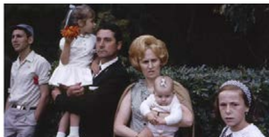
'Gión, agosto, 1996', de Gonzalo Juanes PHOTODIARIO

Perpetuum mobile es también el título de la exposición colectiva que reunirá en el Círculo de Bellas Artes de Madrid el trabajo de 27 fotógrafos y fotógrafas españoles nacidos desde el inicio de la Democracia y que han sido testigos del "cambio de paradigma analógico/digital". No faltará representación española, a través de figuras como Gonzalo Juanes y Javier Campano, además de las pioneras de la perspectiva de género en el país, Pilar Aymerich y Paloma Navares.